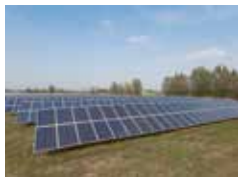
CAMPO FOTOVOLTAICO SOLAR FIELD