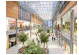
CENTRO COMMERCIALE SHOPPING CENTRE