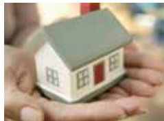
ABITAZIONE PRIVATA PRIVATE HOME