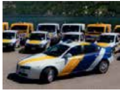
PATTUGLIA MOBILE PATROL