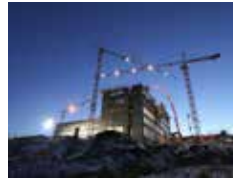
CANTIERE WORK SITE