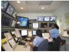
CENTRALE OPERATIVA CONTROL ROOM