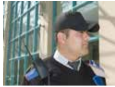
GUARDIA SECURITY GUARD