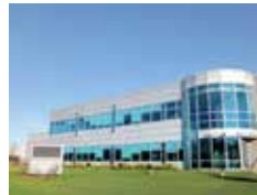
AZIENDA BUSINESS COMPANY